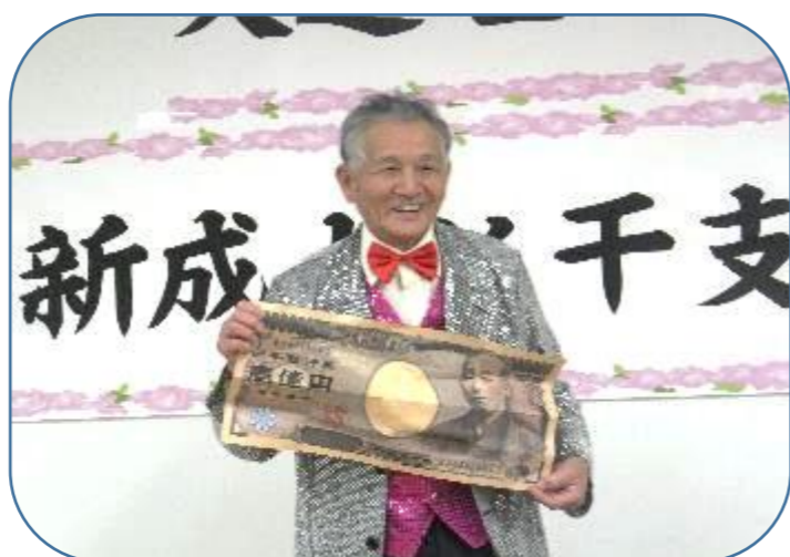
毎年恒例 新春マジックショー 〜まかせてよ 金が湧く里 大道理〜

大道理地区の世帯数と人口 世帯数 188世帯 人口 372人 【男性171人・女性201人】 高齢化率 55.6% (2018年12月31日現在)