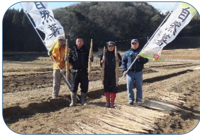
大道理特産品【自然薯】

昨年の十二月から収穫が始まり、最盛期を迎えています。今年の自然薯は昨年の猛暑で土が乾燥し、見栄えも立派で品格よし！粘り風味も文句なし！食物繊維の豊富な自然薯を食べて、お腹もスッキリ！生活習慣病予防をしましょう。