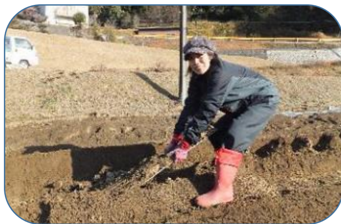
波板シートを抜き取り収穫！