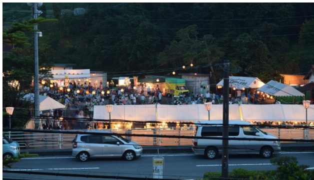
夢求の里交流館から見た「ほたる観賞の夕べ」会場です

「第二十四回大道理ほたる観賞の夕べ」が六月十日（金）、十一日（土）の両日開催され、多くの方にお越し頂きました！