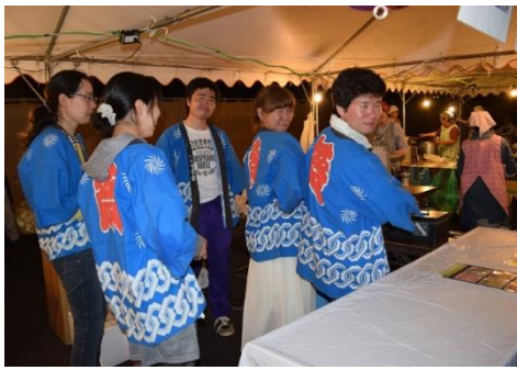
写真上下 バザーでの様子です