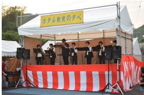
オカリナの演奏をされています