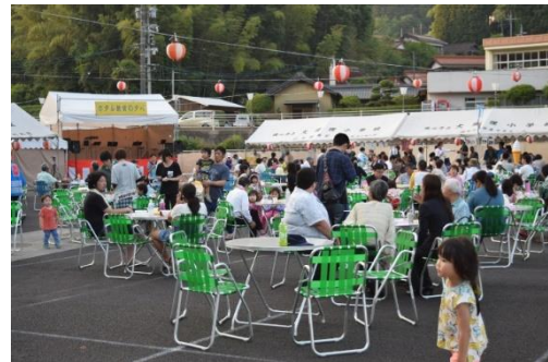
日没前の祭会場の様子です