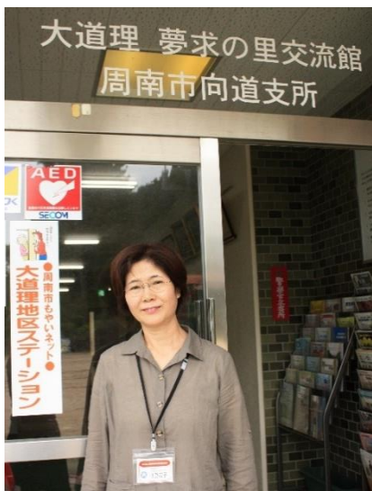
もやいネット大道理地区ステーションの看板の前で。向道支所 夢求の里交流館玄関前にはもやいネットステーションの看板が掛けられています。

活動への思い、これからのこと 訪問してお話する方々は皆さん大道理の大先輩なので、いろんなことを教えて頂けて、自分にとっても学びになります。