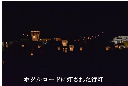
ホテルロードに灯された行灯