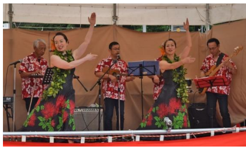
ハワイアンバンドの演奏とフラダンス