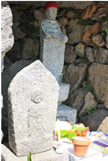
大島地区の観音様です お地藏様と一緒に祀り されています