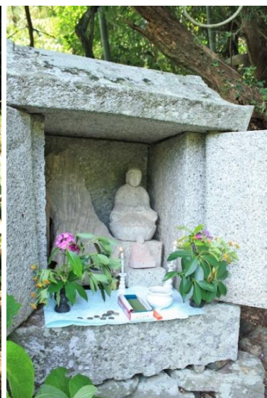
鹿野地地区自然石の観音様です