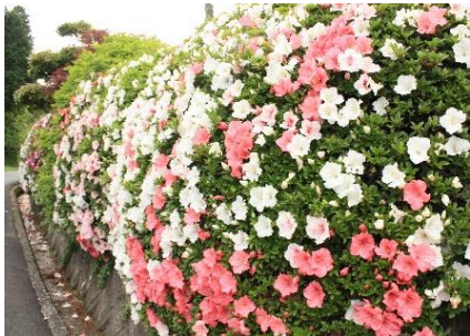
▲6月8日。剪定前のIさん邸のサツキです！