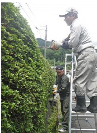
▲剪定作業をしています

剪定作業では翌年、綺麗に花が咲くように剪定の時期や方法などを考えながら作業しています。