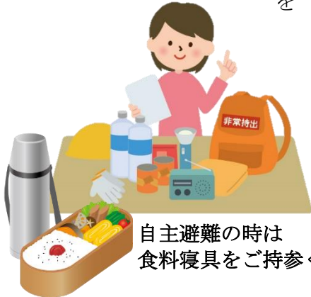
自主避難の時は食料寝具をご持参ください

○気象情報等に注意し、川等が氾濫又は土砂崩れが起きる前に近所等に声を掛け早めに夢求の里交流館に避難。但し自主避難の場合は寝具、食料をご持参下さい。