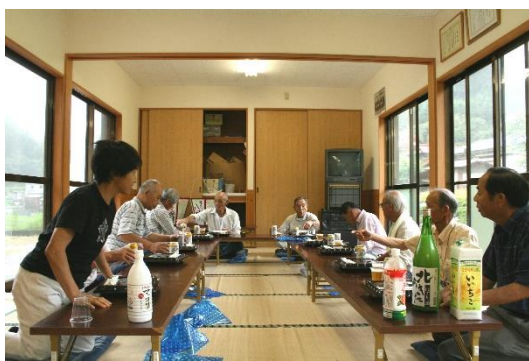
直会（なおり）の風景です！