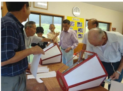
地区の皆さんで行灯を作ります

お祭りの前には、皆さんで朝から草刈りをして、それから神社にお納めする行灯づくりをされます。この日は雨。八朔祭りの日としては珍しいと皆さんがおっしゃっていました。皆さんでこしらえたばかりの行灯を乾かすための舞台裏風景も見ることができました。