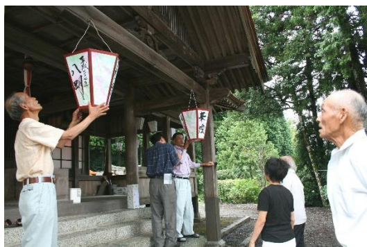
三嶋神社に行灯を納めました