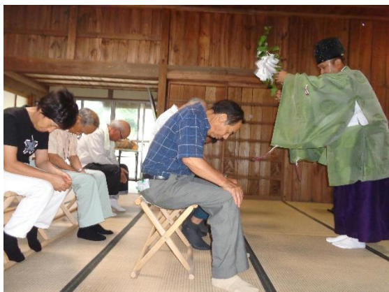
宮司さんがお祓いをされています！

地区ごとに行灯を毎年こしらえて神様へお供えする意味については、行灯の灯りで、神様の御心をなぐさめ喜んでもらい、地域を守ってください、という願いをこめるといいます。こちらは神道というより仏教的ですが、あの世は真つ暗な世界だから、そこに光