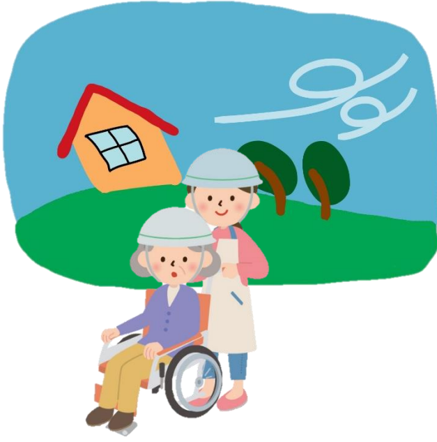
雨風が強まる前に声を掛け合って避難しましょう！

毎年のように、台風や豪雨災害などの自然災害によって、多くの被害が出ています。今年九月の豪雨災害での被害をテレビなどで目の当たりにして、不安になられたり、心を痛められたりされた方も多くおられることと思います。自然災害の時、大切な事は早期避難です。大雨が降る前、風がひどく吹く前に、ご近所さん、各集落で相談しあい、早めに避難する事が大切です。