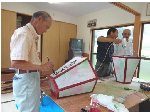
五穀豊穣の祈りを込めて行灯を作っておられます

現在、大道理地区で八朔祭りを、神社に行灯を奉納する地区は数地区となり、今回はこの中の「鹿野地」地区の八朔祭り当日の様子を取材させて頂きました！