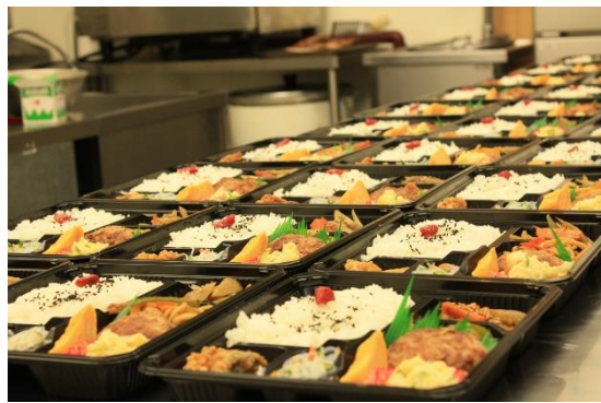
▲完成したまんかい弁当です！

決まったお客様として、周南市の観光案内所「まちのポルト」さんと大道理地区と隣の長穂地区のお一人暮らしの方へお届けしています。「まちのポルト」でまんかい弁当を買って食べてみて、