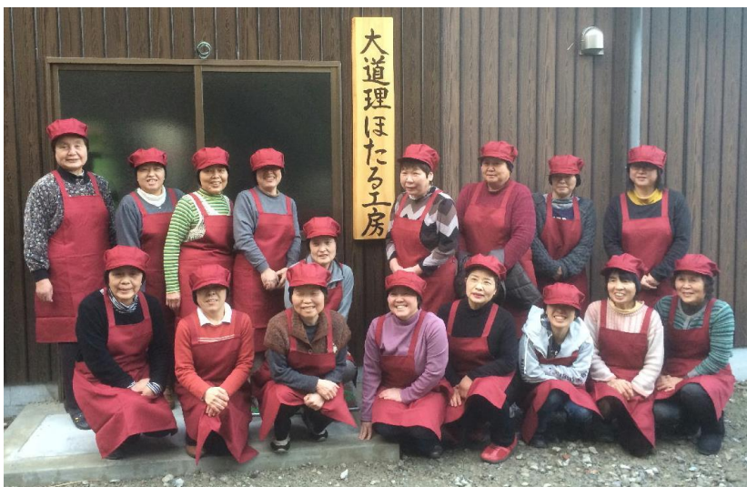
ほたる工房の前で 大道理ほたる工房の皆さん

大道理地区で採れた米、野菜を使い、食品添加物を一切使わない安心安全なお弁当作りをされている「大道理ほたる工房」さん。平成二十七年二月に営業を始められて一年半が過ぎました。加工事業を立ち上げられたきっかけ、思い、それからお弁当作りの中で感じられていることや大道理の皆さんへの思いなど、お話を聞きしました。