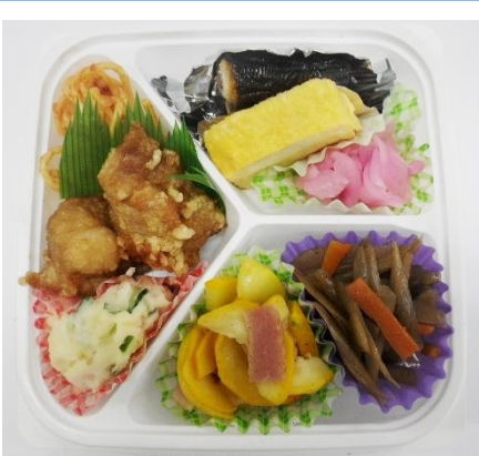
▲おかずのみの400円弁当です

お一人暮らしの方へお届けするお弁当については、昨年長穂地区の民生委員の方から声をかけられて、月、水、金曜日と配達を始めた。五百円弁当と四百円弁当の二種類