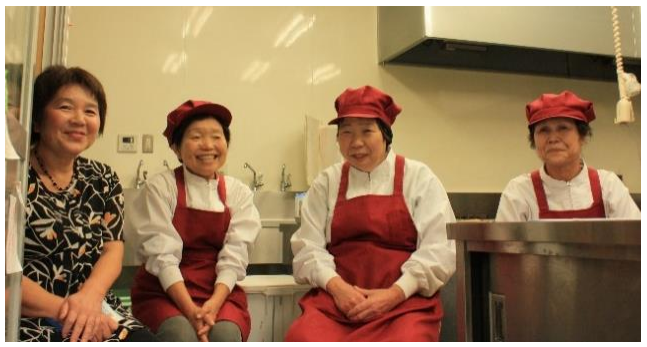
お話を聞かせて下さった皆さん

大道理ほたる工房のお弁当は、大道理産の野菜と米を使って、美味しく安心、安全を心掛けながら作っています。最初の頃は苦情の声も頂きましたが、現在、沢山の方にご注文頂くようになりました。お弁当を食べた方から「美味しかったよ」と言われることが、私たちは一番うれい事です。高齢や独り暮らしをされている方への配食等、地元の方が年齢を重ねた時、安心して大道理地区に住み続けることが出来、少しでも楽に生活できるようにサービスを提供していきたいです。そのために、ほたる工房のメンバーを増やしてこれから先も、継続していける仕組みにしていきたいです。そしてこれから、お弁当の配達だけでなく、月に何回か、生活交通「もやい便」などを利用して頂くなどして、地域の方が集まって食事が出来る食堂のような形で食事を提供する事業もしていきたいと考えています。