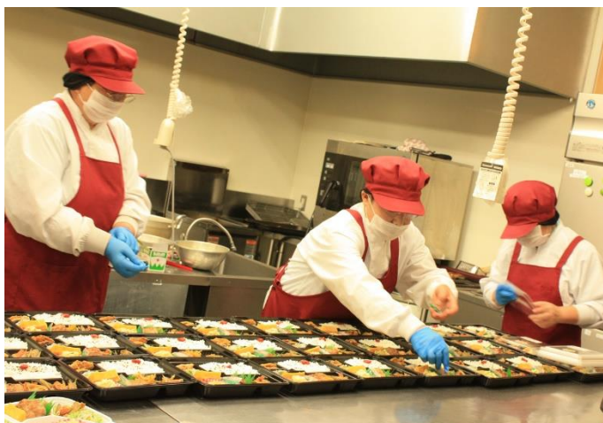
▲朝9時過ぎ。盛り付けをされています！

『ほたる工房は十五人で、お弁当作りをしています。それまでは沢山のお弁当を販売用に作る経験をしたことがない方たちばかりなので、最初は五人で作っても時間が足りないと感じていましたが、今ではだいぶ慣れてきたのか、手際良く作れるようになりました。少ない人数でも時間内にお弁当作りができるようになりました。』 現在、月、水、金、と週三日お弁当づくりをしています。特別注文が入らない時には、だいたい五百円弁当を四十個弱作っています。