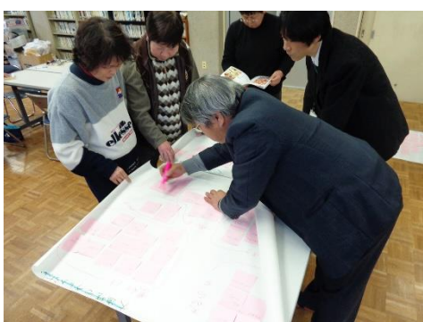
▲ワークショップの様子です

ほたる工房立ち上げのきっかけについてお聞きしたところ、「初めは、お弁当作りの加工事業をすることになることは予想していませんでした。大道理をよくする会の経済部で、漬物作りなどの加工品づくりをする時に、話をしながら皆で作っていたことが楽しく、大道理地区でこういう感じのことが出来たらいいなという思いはありました。それから平成二十三年から芝桜まつりが始まると、来られたお客様に食事を提供しようということになりましたが、うどん等の軽食をお出ししようにも、加工所がないと出せないため、「そういうものがあつたらいいね。」ということになりました。