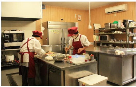
▲ほたる工房内観 お弁当作りを終えて、後片付けをされています

ほたる工房の施設については、市、県の助成金と、大道理地区の皆さんの寄付のおかげで設備が整い、加工所が出来上がりました。