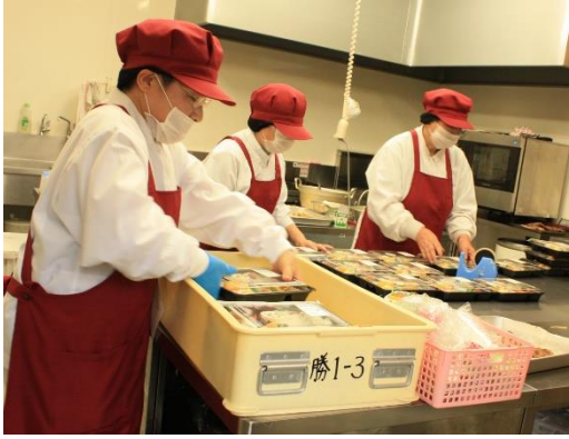
▲お弁当をこれから配達されます

お弁当を作ってお届けする事業は、まず時間通りにお届けしないといけないことが大前提になります。約束の時間に間に合わず、お客様に謝ったということがありました。それから、いつもご注文下さる方が飽きない献立作りには頭を悩ませます。ほたる工房のお弁当に使う食材は大道理産の野菜、お米を使っているため、献立作りも、大道理の中で、どのお家で今、何が採れるかを考えながら作っています。半月分の献立を立てるようになっていますが、新しいメニューのものをいざ作ってみると、予想外に時間がかかったり、作り方が難しかったりするので、実際に作ってみないとわかりません。「まちのポート」さんから最初、「お弁当が野暮ったい」といわれたこともありましたが、皆が他の業者さんのお弁当を食べるなど、常にアンテナを張って研究して、話し合いながら工夫していく中で「良くなったね」と言われるようになりました。