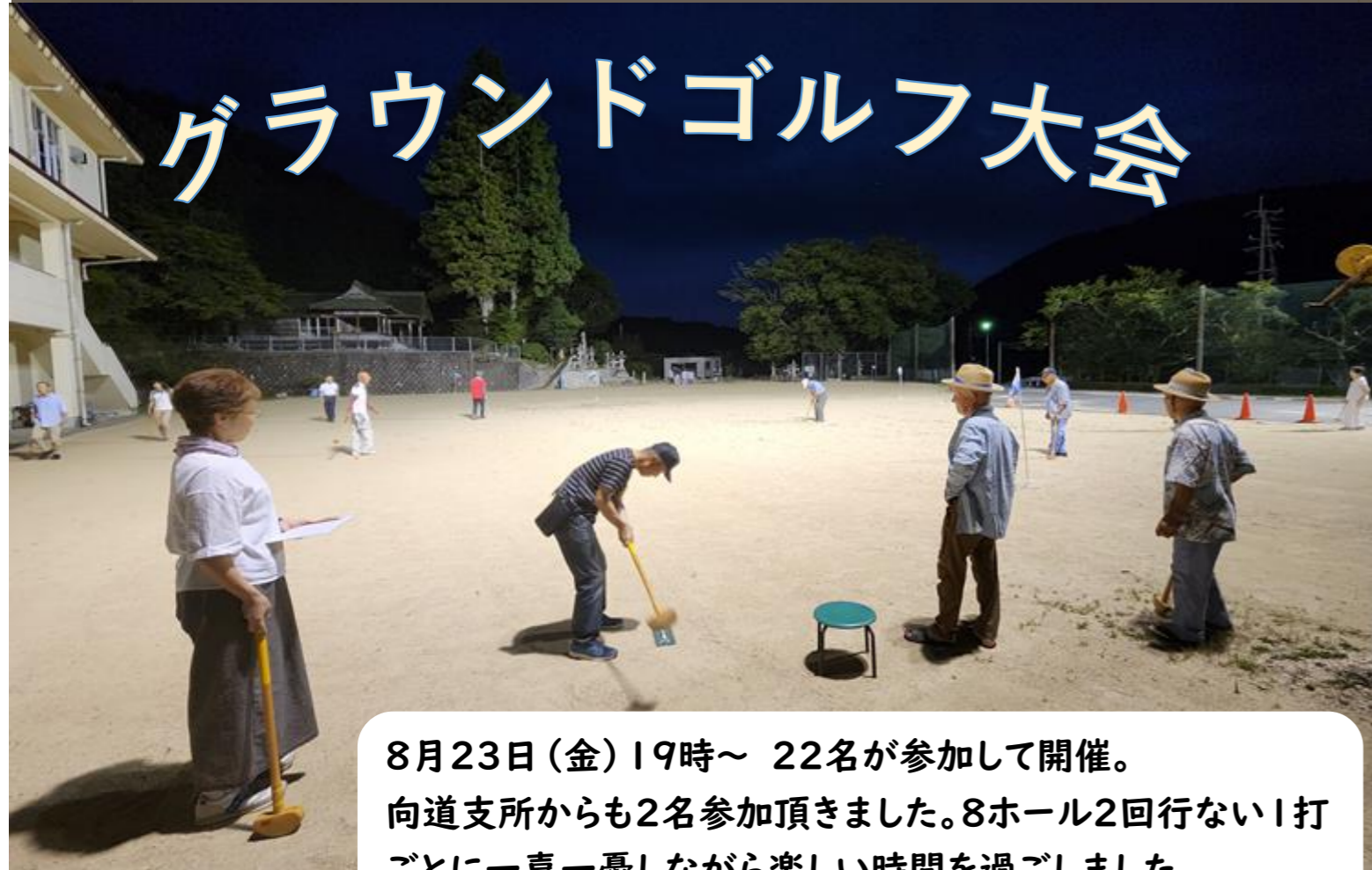
8月23日(金)19時～ 22名が参加して開催。 向道支所からも2名参加頂きました。8ホール2回行ない1打ごとに一喜一憂しながら楽しい時間を過ごしました。