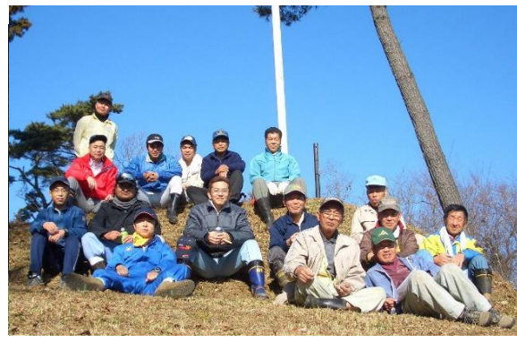
大高山を守る会と大道理体育振興会の皆さん

二〇〇二年、「大高山を守る会」が発足し、二月、六月、九月、十二月の年四回、登山道、山頂周辺や展望所の草刈り、倒木の片付けなどの活動をされています。