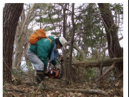
倒木を片付けておられます