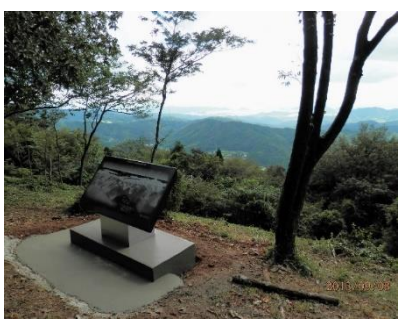
眺望図が出来上がり、展望所から、どこを眺めているかがパッチリ分かります！