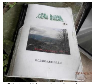
「登山記録帳」。登山者の方からの感謝の言葉が綴られています

それから、活動をされていて、印象に残っていることについて、一つ、挙げて下さいました。「展望所から徳山湾を見て、水平線に見えるホトケキミみたい大きな黒い影は何？雲？」調べたら大分県の国東半島だったんですね。そんな遠くまで見えるのは驚きでした。空気が澄んだ天気の良い日は、見ることが出来ます。