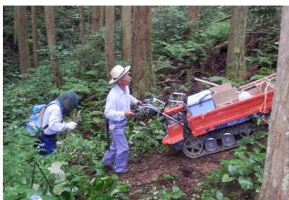
2013年9月に行われた、定例作業での資材運搬の様子です

右の写真は、二〇一三年、展望所に眺望図を設置された時のもので、上の写真は、二〇一三年九月の作業時での資材運搬の様子を写したものです。皆さんが工事の資材を山頂まで持つて上りながら、作業されている様子が伝わってきます。