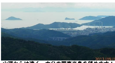
山頂からは遠く、大分の国東半島を望めます！

それから、活動をされていて、印象に残っていることについて、一つ、挙げて下さいました。「展望所から徳山湾を見て、水平線に見えるホトケキミみたい大きな黒い影は何？雲？」調べたら大分県の国東半島だったんですね。そんな遠くまで見えるのは驚きでした。空気が澄んだ天気の良い日は、見ることが出来ます。