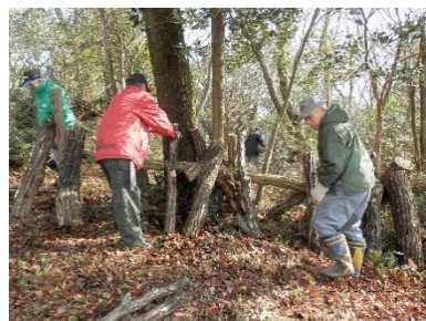
椎茸の原木を設置する作業風景です

現在、展望所からは、大道理地区内や周南工業地帯、瀬戸内海を望むことができますが、発足のきっかけとなったエピソードでもお聞きした通り、当初は草や木が生い茂っていました。会が発足した二〇〇二年(平成十四)年、登山口に案内看板を設置され、展望所の開拓をされました。その後の主な活動としては、二〇〇三年、海軍施設の表示板を設置、展望所にベンチ設置、登山記帳簿作成、登山案内マップの作成をされ、翌年の二〇〇四年、山頂にベンチを設置されました。