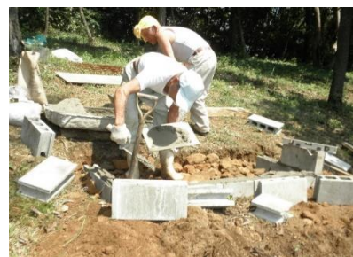
2013年9月に行われた、眺望図設置工事の様子です

二〇〇五年には、登山されたい方にご自由にお持ち帰り頂ける無料椎茸の原木を設置。二〇一三年、展望所に眺望図設置。二〇一四年、無料椎茸の原木を設置。と、登山される方が、安全に登山し、なおかつ大高山の魅力を感じて帰られるよう、整備活動がされています。