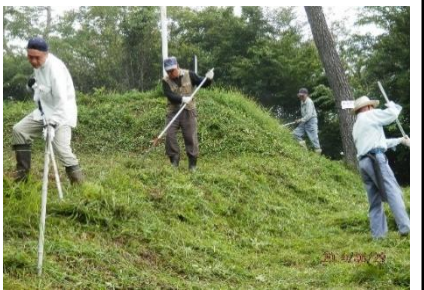
定例の草刈り作業の様子です

会員さんに、活動される中で大変なことについてお聞きしたところ、「重い草刈り機やチェーンソーなどを担いで作業しながらの登山ですから、山に登るのに一苦労です。加えて、内輪の話ですが、燃料や刃は会員の自腹ですから、参加していただく会員さんには頭が下がります」と、教えてくださいました。