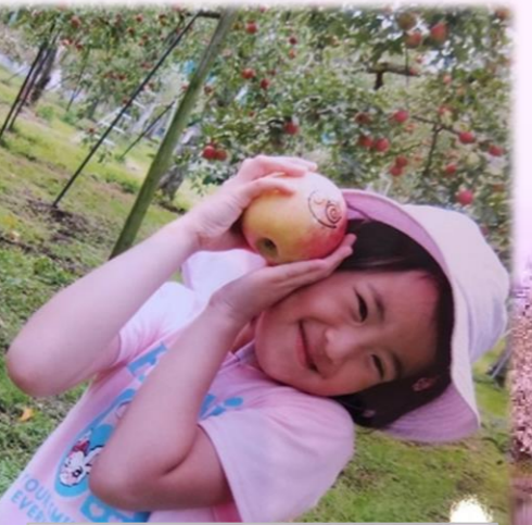
井上さん(小1) ♥お友達をたくさん作りたいです。(中村)